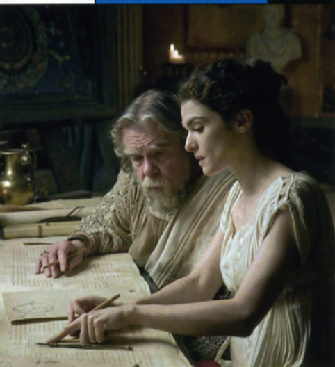
20th Century Fox

DIRECTOR: Alejandro Amenábar. INTERPRETES: Rachel Weisz, Max Minghella y Oscar Isaac. NACIONALIDAD: España FORMATO: DVD / BluRay. DISTRIBUYE: 20th Century Fox. PRECIO: 16,95, 21,95, 28,95 y 29,95 €.