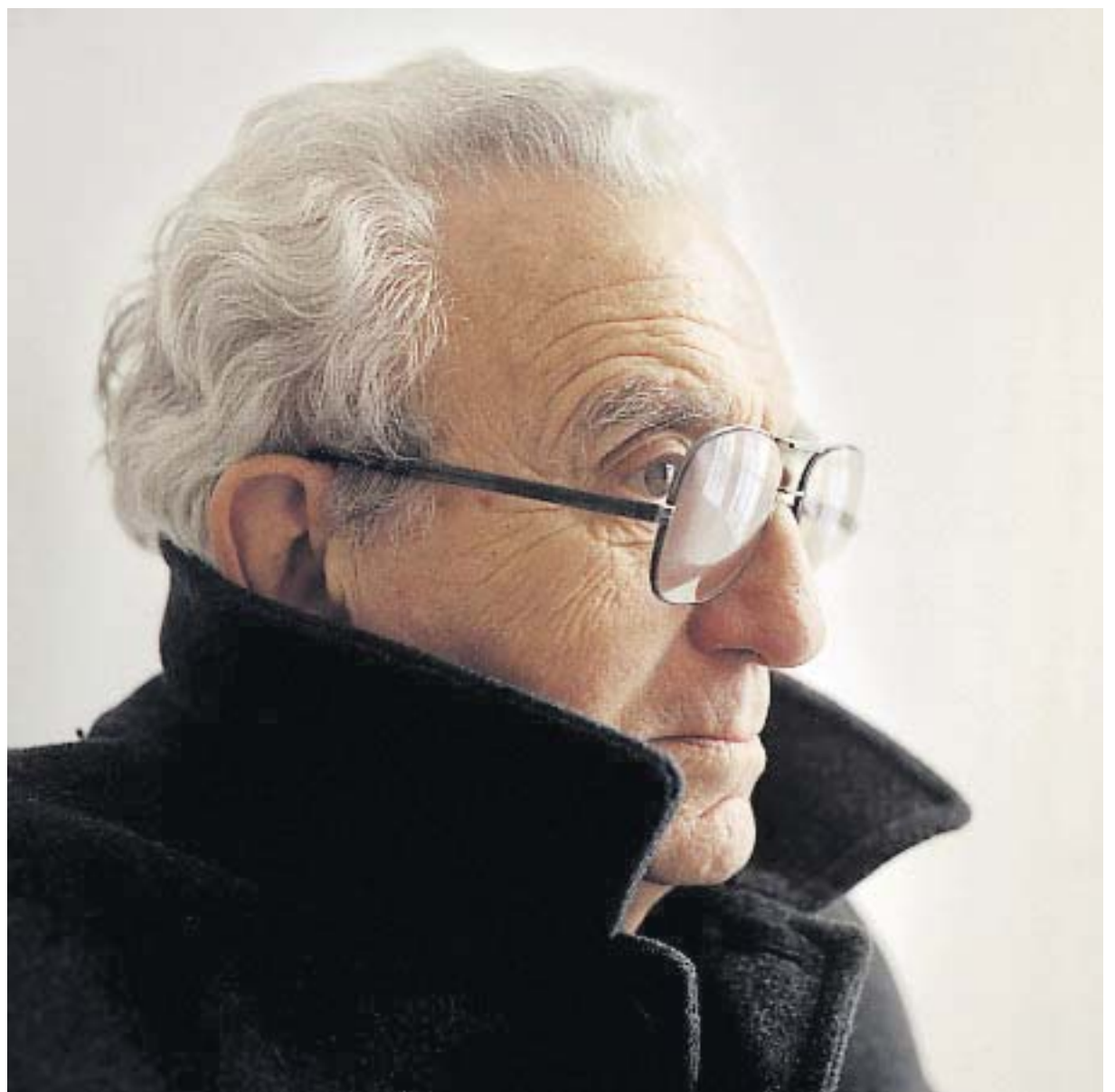
ANGEL WAGENSTEIN, AUTOR DE 'EL PENTATEUCO DE ISAAC'

Aunque no solo hay risa —y la que escuchamos no es metálica, sino inteligente y triste—. Blumenfeld pierde a casi toda su familia y muchos años de libertad. Azotado por los vientos de la Historia, se despierta ciudadano de Galitzia y se acuesta polaco, para volver a amanecer soviético y luego convertirse en parásito que el Reich se complace en exterminar. Y cada vez, quieren convencerle de que ése es su propio deseo y su conveniencia. El