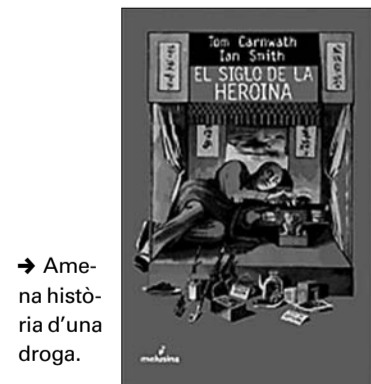
→ Amena història d'una droga.

Són tots els consumidors d'heroïna ionquis? Evidentment, no: hi ha hagut exemples abundants d'artistes que han compaginat una activa vida creativa i l'addicció. Banalitzem el consum d'heroïna, doncs?: en absolut, perquè