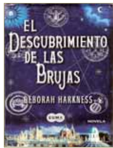
Deborah Harkness Suma de Letras