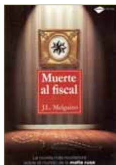
J. L. Melguizo Plataforma