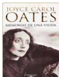
Joyce Carol Oates