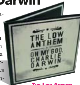
THE LOW ANTHEM Oh my God, Charlie Darwin (Bella Union, 2009)