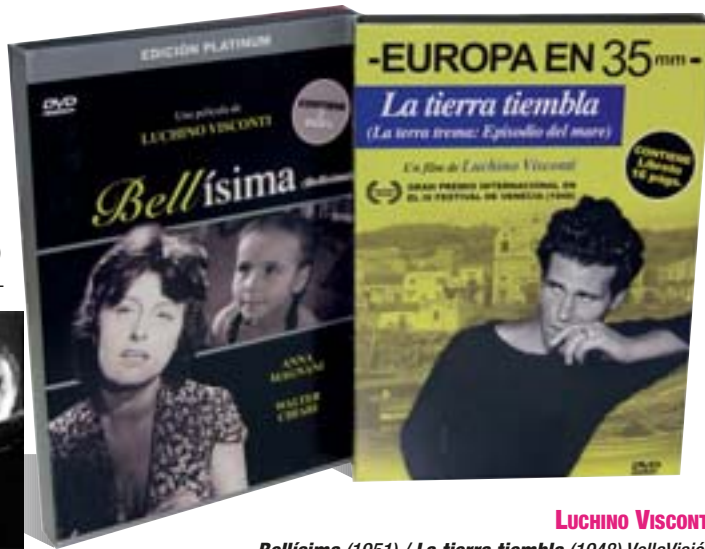
LUCHINO VISCONTI Bellísima (1951) / La tierra tiembla (1948) VellaVisión

Uno de los teóricos marxistas más importantes, Guido Aristarco, autor de La disolución de la razón , comentó de La terra trema (1948) que representaba a la perfección la no alienación del hombre por su mutabilidad frente al sometimiento de éste a las cosas, algo que la ha convertido en una referencia obligada del Neorrealismo. Aparte de planteamientos filosófico-políticos, Visconti escoge a un atrasado pueblo de pescadores sicilianos, Aci Trezza, para denunciar la opresión económica y cultural, que el narrador de la cinta equipara al de la historia de la humanidad. Con actores no profesionales, recuerda en su planteamiento a Las Hurdes, tierra