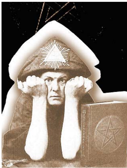
Aleister Crowley, vestido para un ritual mágico.

DANI R. MOYA La madre del pequeño Edward Alexander Crowley le gritaba, siempre que hacía alguna travesura, que era una mala bestia. Y no andaba muy equivocada la mujer. A esa misma conclusión, orgulloso, llegó el mismo Crowley al crecer y autodenominarse como la "Gran Bestia 666", el ser más perverso del planeta, como a él le gustaba que le llamasen. El mago más influyente de todo el siglo XX coqueteó con el lado oscuro y creó una corriente de pensamiento mágico que hoy día continúa teniendo adeptos.