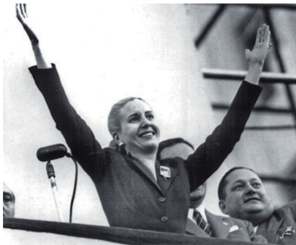
Krauze dibuja perfiles como el de Eva Perón, «madona de los descamisados»

La primera parte la dedica a los cuatro profetas de la redención: el cubano José Martí, al que presenta como «el último liberal del siglo XIX, que pudo soñar con una constelación de repúblicas americanas orientadas al progreso y respetuosas entre sí, con quien murió el proyecto de una América homogénea e igualitaria»; el idealista uruguayo José Rodó; el educador mexicano José