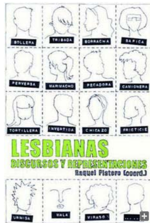
Portada del libro.