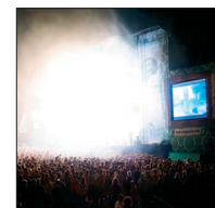
Varios Fotógrafos "Benicàssim. El festival" MUSAC-FIBERFIB

El ruso de origen judío Ilya Ehrenburg, quizá defraudado al disgustarle la traslación a la pantalla de "Die Liebe der Jeanne Ney" (1927), más bien por su carácter de activista, dejó entre sus escritos como cronista unos textos dedicados al séptimo arte, la fábrica de sueños, término que él mismo acuñó en su día y que titula este pequeño y feroz librito. Existía una edición previa, pero la publicada por Melusina es la que el propio autor dio por definitiva en 1966, un año antes de su muerte. "La fábrica de sueños" se sustenta en la forma de una extensa proclama envenenada, pero también puede leerse como un "Hollywood Babilonia" marxista, que apunta a los pioneros empresarios del cine: Zukor, Goldwyn, Hugenberg, Eastman, y demás, los rockefellers de la industria, los magnates que se enriquecieron con los peniques que los trabajadores de sus compañías se dejaban en los nickelodeons . Anticipo de la historia, escalofriante radiografía del pasado, sin duda, una más que recomendable y didáctica lectura. Arantxa Ruiz