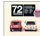
Varios Autores "72 horas. La ruta a Valencia" BLANCO Y NEGRO