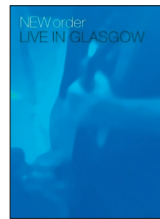
New Order "Live in Glasgow" WARNER

El visionado de este doble DVD documenta en imágenes la faceta de directo de una de las bandas más importantes de la música independiente. Pese a eso, curiosamente no hace más que confirmar las grandezas y miserias de New Order. El DVD que recoge una de las actuaciones de su última gira, en Glasgow, nos muestra una banda que pese a la potencia de su cancionero no consigue que luzca como debería. El segundo DVD, el que muestra una selección de actuaciones en directo grabadas entre 1981 y 1989, evidencia la pérdida progresiva de su genialidad. Los conciertos más añejos son un prodigio de modernidad, de suave agresividad, una defensa digna de su mítico pasado como Joy Division y de cómo son capaces de llevarlo hacia nuevos e interesantes caminos electrónicos. Ese espíritu innovador, arriesgado y formalmente impecable se va marchitando poco a poco con el tiempo, es decir mientras avanzan los minutos del DVD. Así, pese a contener momentos memorables, el segundo disco deja el sabor agri dulce de comprobar cómo las musas van abandonando gradualmente el grupo a su suerte. Josep Martín