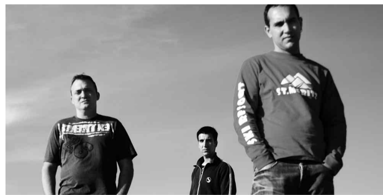
→ Un trio de tonades senzilles i sempre emotives.

nes?: la concisió—sempre durada de single —, l'optimisme, la senzillesa en l'apartat rítmic i la cura en la melodia i les tornades.