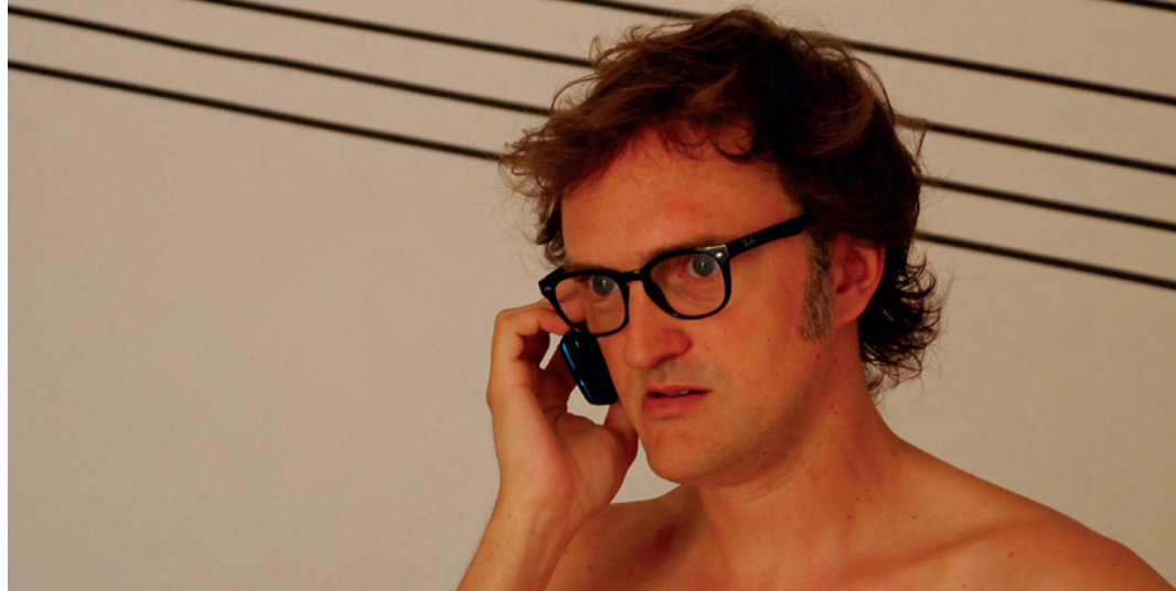
FOTOGRAFÍA: LILA SIEGRIST