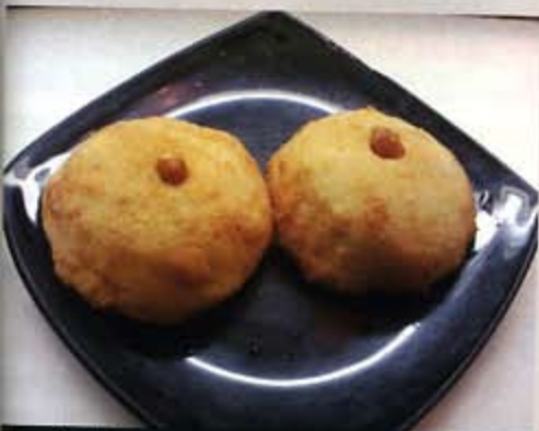
Los "minne" que dan pie (o pechos) a este libro.

"Un dulce par de senos", de Giuseppina Torregrossa, es una inmersión en la vida de tres generaciones de mujeres sicilianas a lo largo del siglo XX y a través de sus cocinas.