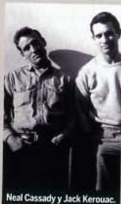
Neal Cassady y Jack Kerouac.

"Beatitud" es el tributo de 33 autores a una generación que les cambió la forma de ver el mundo.