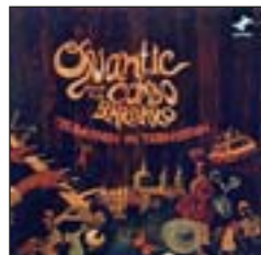
QUANTIC AND THE COMBO BARBARO Tradition and transition (Tru Thoughts, 2009)

¡Qué bonito álbum (en música y diseño). Es elegante, indie , sobrio y a la vez fresco. Muy agradable este segundo disco de este grupo de Berlín. "Crear reglas es más creativo que destruirlas".