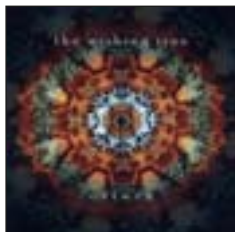
THE WISHING TREE Ostara (Ear Music / Edel, 2009)

DJ Ease, jefe de Wax On Records y miembro de Nightmares On Wax , reúne y remezcla los talentos musicales del sello. Beats de alta calidad para las noches reposadas del verano.