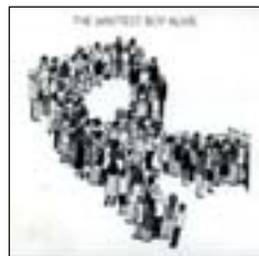
THE WHITEST BOY ALIVE Rules (Bubbles, 2009)

Tras esta cantante británica todo el soul y el funk que destrozó las pistas en los 80 aderezado con una voz rica y potente que nada tiene que envidiar a las más grandes.