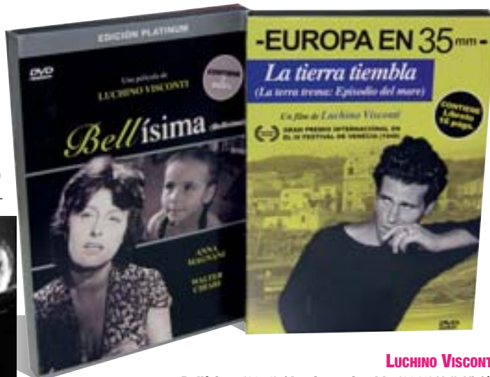
LUCHINO VISCONTI Bellísima (1951) / La tierra tiembla (1948) VellaVisión

Uno de los teóricos marxistas más importantes, Guido Aristarco, autor de La disolución de la razón , comentó de La terra trema (1948) que representaba a la perfección la no alienación del hombre por su mutabilidad frente al sometimiento de éste a las cosas, algo que la ha convertido en una referencia obligada del Neorrealismo. Aparte de planteamientos filosófico-políticos, Visconti escoge a un atrasado pueblo de pescadores sicilianos, Aci Trezza, para denunciar la opresión económica y cultural, que el narrador de la cinta equipara al de la historia de la humanidad. Con actores no profesionales, recuerda en su planteamiento a Las Hurdes, tierra