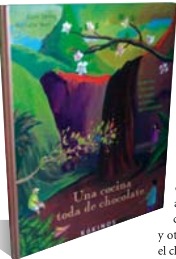
ALAIN SERRES Y NATHALIE NOVI Una cocina toda de chocolate (Kókinos, 2009)