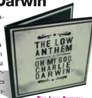
THE LOW ANTHEM Oh my God, Charlie Darwin (Bella Union, 2009)