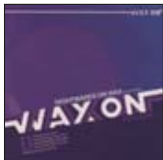
VVAA / DJ EASE ...presents Wax On vol2 (Wax On, 2009)

Vivir en Colombia ha influido al inglés William Holland (aka Quantic ). Si no, escuchan este bárbaro combo que fusiona el deep soul con los ritmos caribeños.